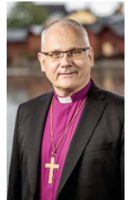
Biskop Bo-Göran Åstrand

Anmälningar till visitationsstämman med lunch: 019-241 1060, vardagar kl. 10–12. Sista anmälningssdag: