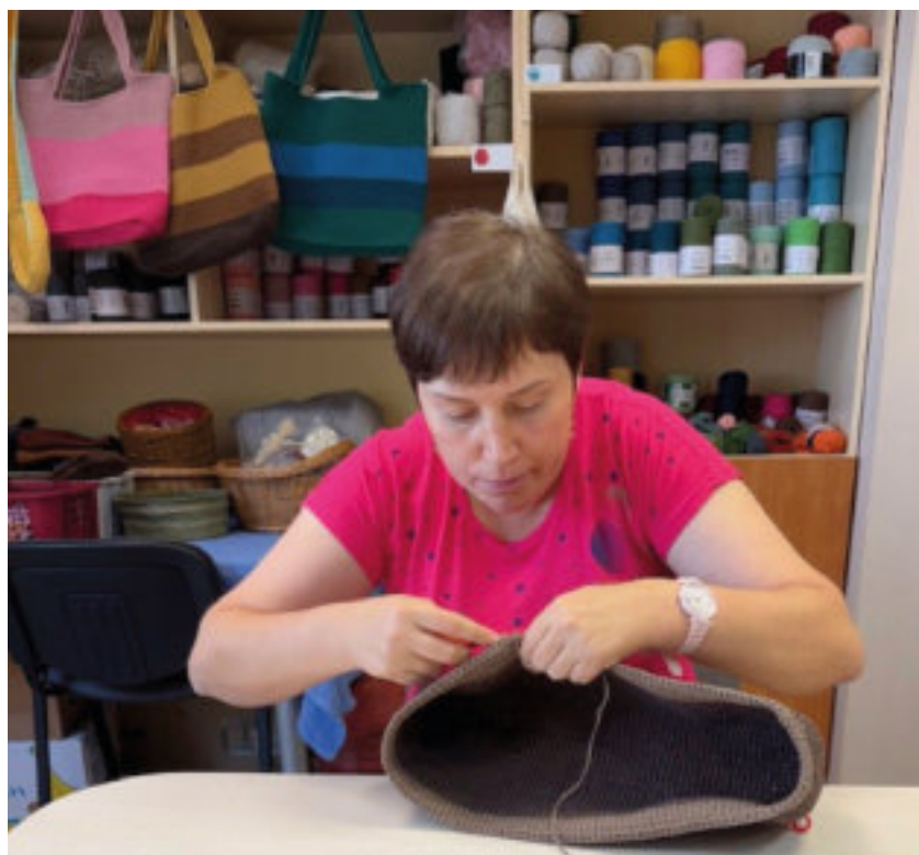
Väsktillverkare på Joniškis kriscenter.